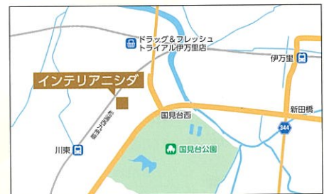
伊万里市二里町大里甲 2350-1