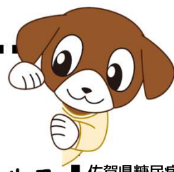
佐賀県糖尿病対策キャラクター「ナナ」ちゃん

肝がん予防、歯、口の健康、卒煙支援、メンタルヘルス等、希望に応じた健康教育を実施しています